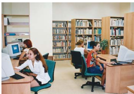
Tradition – qualité - succès

Les salles d'apprentissage sont équipées par des technologies d'informatique et de communication récentes, y compris l'accès à l'internet. La bibliothèque et la salle d'études sont également largement utilisées.